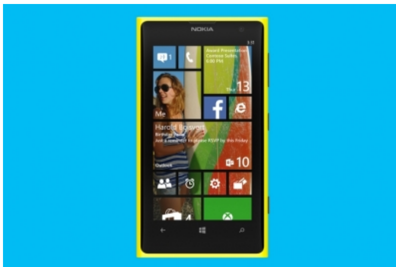
Figura 2. Telefone móvel de Sistema Operacional Windows Phone 8.1

No entanto o sistema operacional Windows Phone possui uma gráfica muito simples mas que a sua linguagem de programação não é muito conhecida, esse motivo impede os hackers desenvolverem softwares maliciosos para os dispositivos móveis celulares.